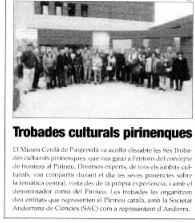
Trobades culturals pirinenques