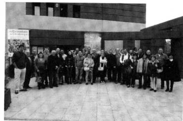
Foto de família dels participants a les 9es Trobades Culturals Pirinenques.